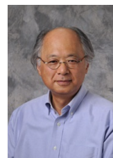
(愛知工業大学HPより)