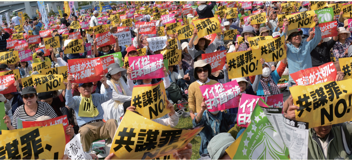
2017年「施行70年、いいネ！日本国憲法5・3集会」5万5000人参加(東京・有明防災公園)

“安倍9条改憲”反対の一点で手をつなぎましょう。3000万人の「戦争はイヤだ」の声を集めて、9条を未来につないでいきましょう。